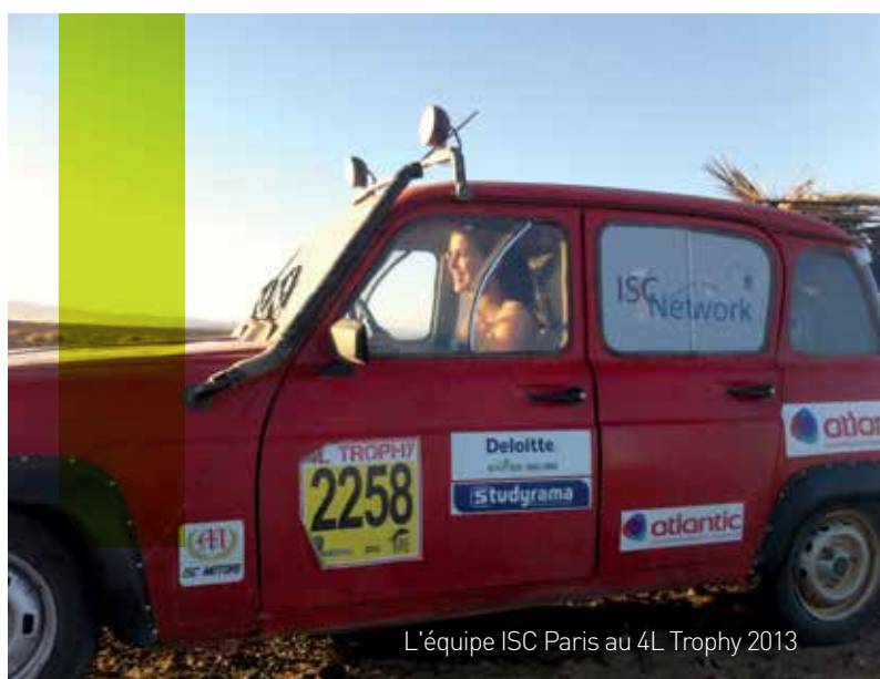
L'équipe ISC Paris au 4L Trophy 2013